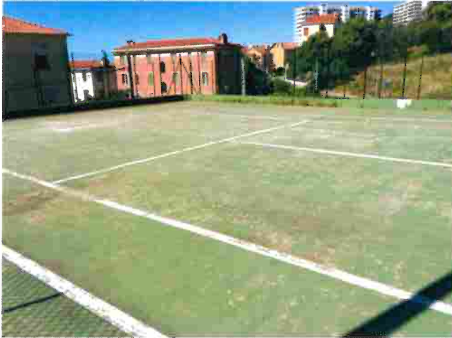
Revêtement du cours en dur fortement détérioré