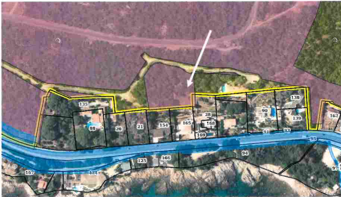
Zone de compensation actuelle