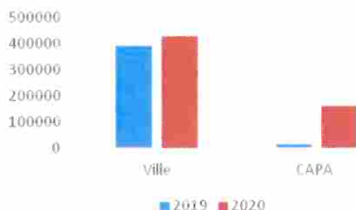
Comparaison des rémunérations - Opérations Ville et CAPA