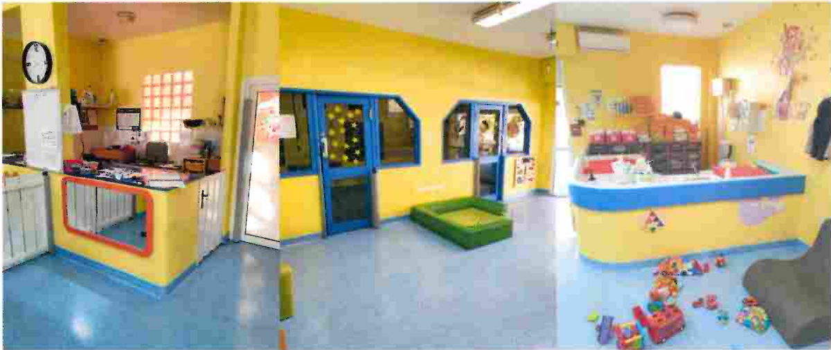
Espace préparation / cuisine