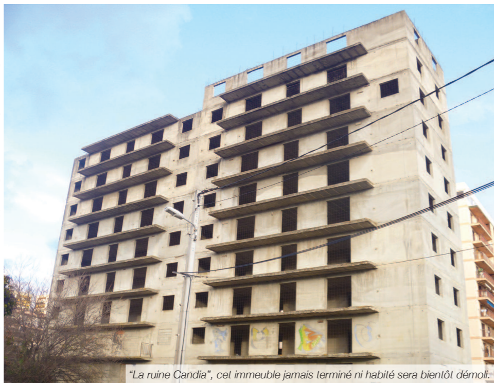
"La ruine Candia", cet immeuble jamais terminé ni habité sera bientôt démoli.

Cette réserve foncière offrira de nouvelles possibilités en terme d'aménagement de réhabilitation. En parallèle au projet de parking d'une quarantaine de places (cf article "chaque jour des actions de proximité") pour satisfaire les besoins existant notamment lors de la dépose et du ramassage des élèves de l'école Jérôme Santarelli, la municipalité souhaite mener une réflexion en concertation avec les habitants.