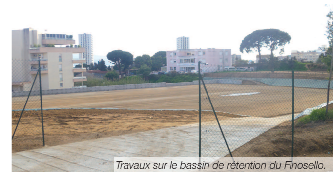
Travaux sur le bassin de rétention du Finosello.

Le montant des travaux s'est élevé à 614 462 € HT.