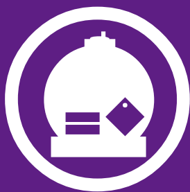
Transports de matières dangereuses