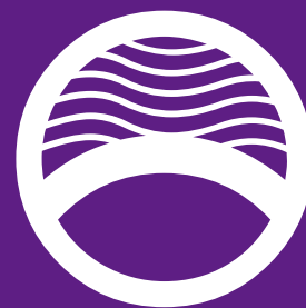
Rupture de barrage