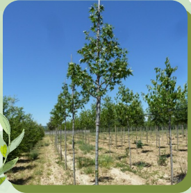
LIQUIDAMBAR STYRACIFLUA COPALME D'AMÉRIQUE