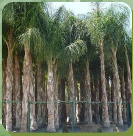
SYAGRUS ROMANZOFFINA PALMIER DE LA REINE