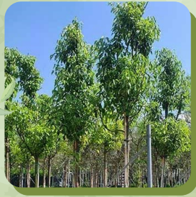
PISTACHIA CHINENSIS PISTACHIER DE CHINE