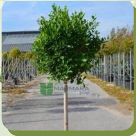
FICUS NITIDA FIGUIER INDIEN