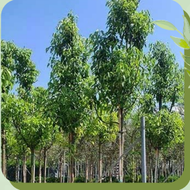
CINNAMONUM CAMPHORA CAMPRIER