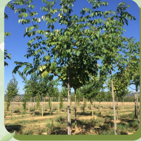
EUODIA DANIELLI ARBRE À MIEL