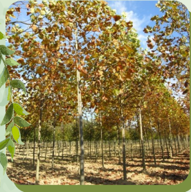
LIRIODENDRON TULIPIFERA FASTIGIATA TULIPIER DE VIRGINIE