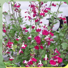
SALVIA CHERRY LIPS SAUGE ARBUSTIVE BLANCHE ET CERISE