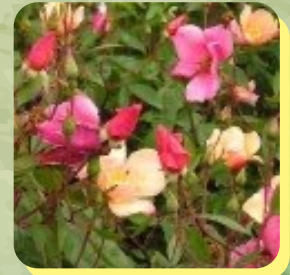
ROSA CHINENSIS MUTABILIS ROSIER ROSE DE CHINE À FLEURS CHANGEANTES