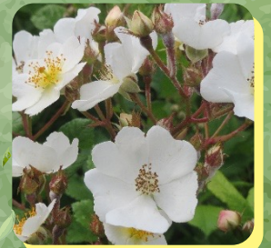
ROSIER POLYHANTA BLANC VARIÉTÉ ICEBERG ROSIER FÉE DES NEIGES