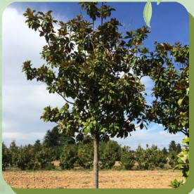
MAGNOLIA GRANDIFLORA NANTAIS MAGNOLIA NANTAIS