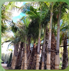
ARCHANTOPHOENIX ALEXANDRAE PALMIER ROYAL D'ALEXANDRA