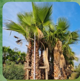
WASHINGTONIA ROBUSTA PALMIER DU MEXIQUE