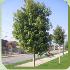
BRACHYCHITON ACERIFOLIA FLAMBOYANT D'AUSTRALIE