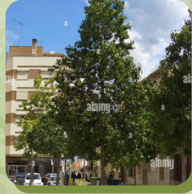
BRACHYCHITON POPULNEUS KURRAJONG