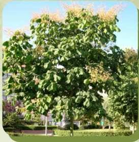
FIRMINIA SIMPLEX ARBRE PARASOL DE CHINE