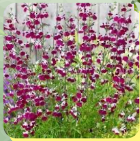
SALVIA AMETHYST LIPS SAUGE ARBUSTIVE BLANCHE ET VIOLETTE