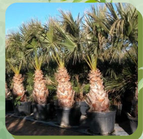
WASHINGTONIA FILIFERA PALMIER DE CALIFORNIE