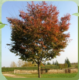
ZELKOVA SERRATA ZELKOVA DU JAPON