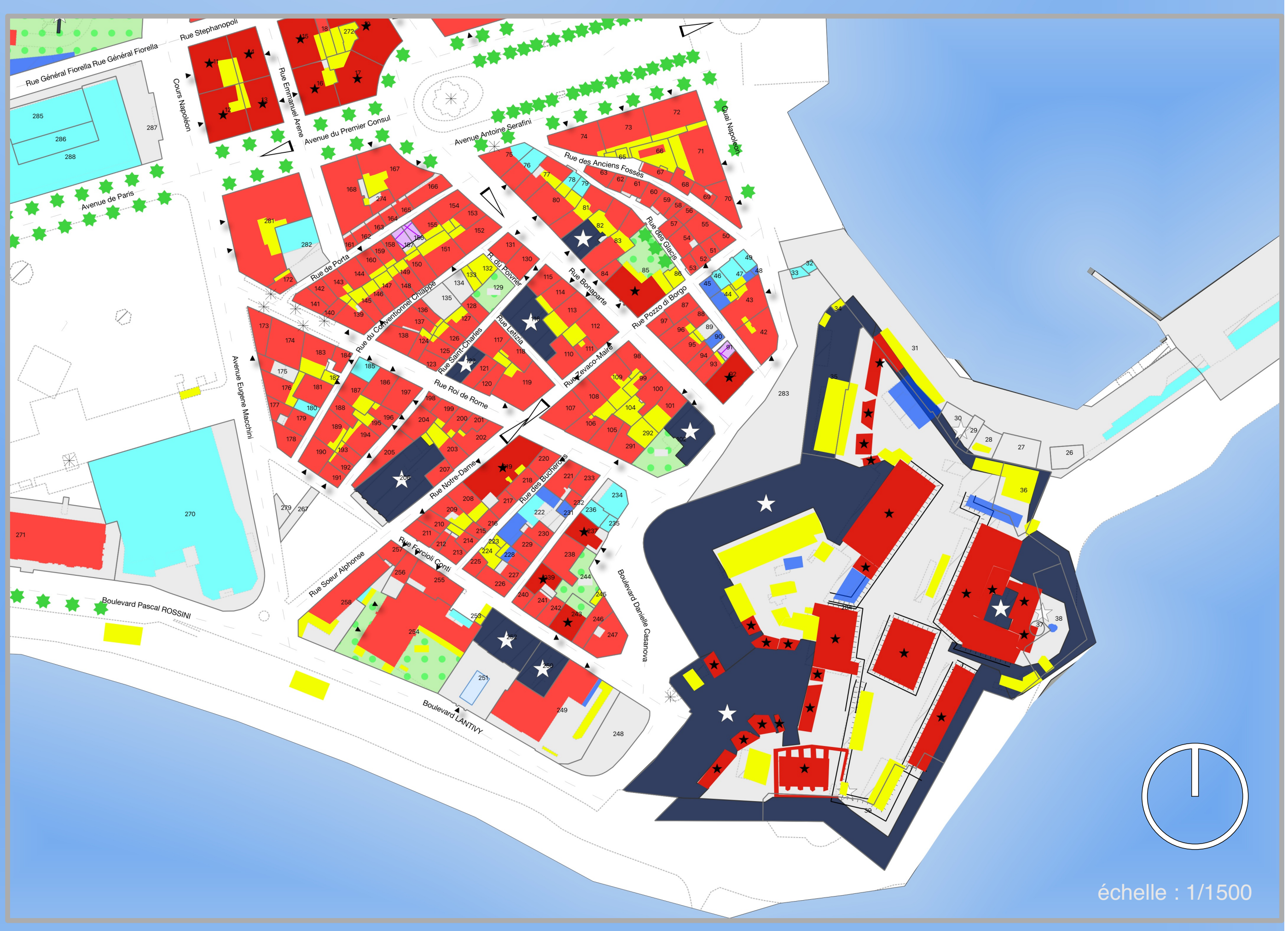
échelle : 1/1500