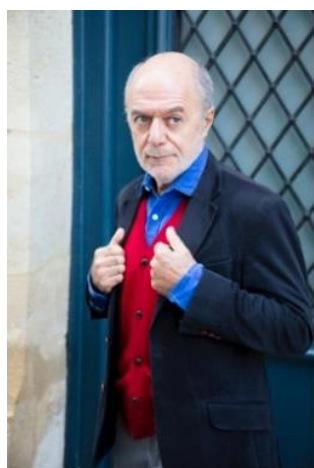
Pierre ASSOULINE 2017

Pierre Assouline est un écrivain français, lauréat du Prix de la langue française en 2007 et membre de l'Académie Goncourt depuis 2012. Il est l'auteur d'une trentaine de livres, dont plus de douze biographies ( Albert Londres, Vie et mort d'un grand reporter 1884-1932 , Balland, 1989, Prix de l'essai de l'Académie française) et de tout autant de romans ( Lutetia , Gallimard, 2005 ; Vies de Job , Gallimard, 2010). Son dernier roman, Le Nageur , retrace le destin du nageur Alfred Nakache, déporté et survivant d'Auschwitz (Gallimard, 2023). Homme de radio -il travaille pendant près de vingt ans pour France Inter et RTL-, Pierre Assouline est désormais producteur de séries et d'adaptations théâtrales sur France Culture. Professeur, il enseigne l'écriture à Sciences Po-Paris. Journaliste, il collabore régulièrement à L'Histoire , au Monde 2 ou à L'Express , en tant que chroniqueur de la vie littéraire : une casquette arborée régulièrement dans l'incontournable République des livres , le blog qu'il crée en 2005 à l'aube de l'explosion d'internet.