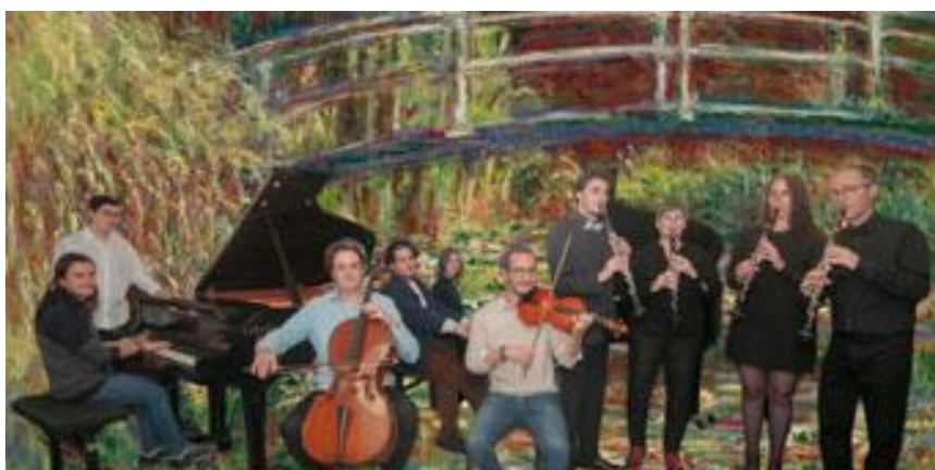
Les musiciens du conservatoire Henri Tomasi

21h : concert-conférence Monet et les compositeurs de son temps : Claude Debussy et Gabriel Fauré avec les musiciens du conservatoire Henri Tomasi