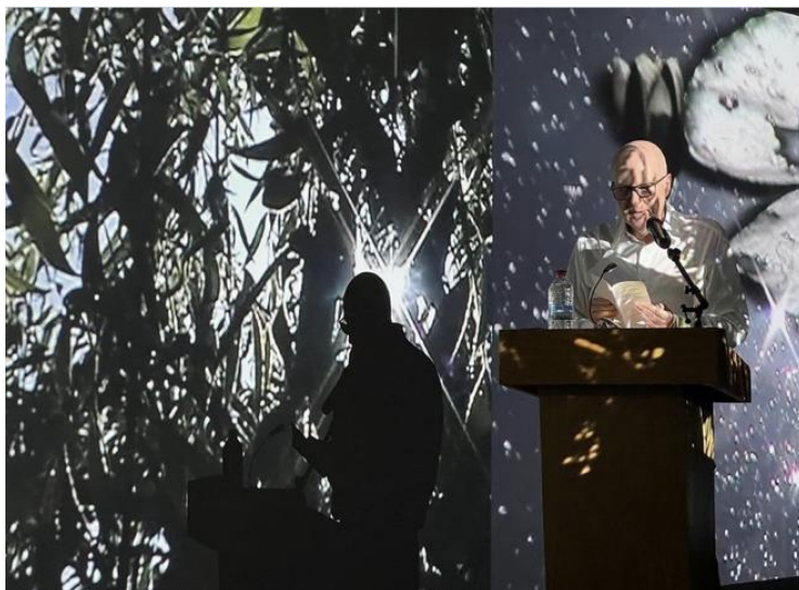
Lecture de L'instant précis où Monet entre dans l'atelier par Jean-Philippe Toussaint au Musée des Impressionismes de Giverny dans le cadre de l'exposition Au film du temps d'Ange Leccia

19h30 : Lecture et rencontre entre Ange Leccia et Jean-Philippe Toussaint autour du livre L'Instant précis où Monet entre dans l'atelier (éd. de Minuit, 2022) Médiation : Pierre Assouline