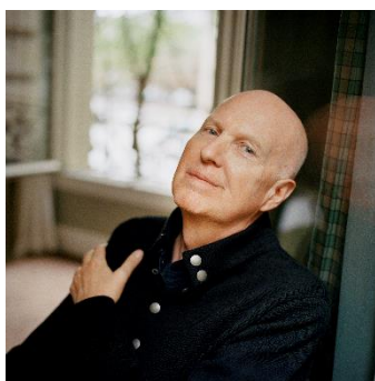
Jean-Philippe Toussaint- 2023

Originaire de Bruxelles, Jean-Philippe Toussaint est écrivain, cinéaste et photographe. Il est l'auteur de vingt livres publiés aux éditions de Minuit, ainsi que de la traduction d' Échecs de Stefan Zweig, effectuée parallèlement à l'écriture de son dernier roman, L'Échiquier (2023), interrogation sur son propre rapport au jeu d'échecs. En 2005, Fuir obtient le prix Médicis tandis que La Vérité sur Marie est le lauréat du prix Décembre 2009 - des ouvrages qui seront traduits en plus de vingt langues. Naviguant de l'écriture à l'image, il réalise quatre longs métrages pour le cinéma et présente ses photos dans le monde entier : en 2012, l'exposition LIVRE/LOUVRE , tenue au musée du Louvre, s'inaugure sur un mur de 84 images de Jean-Philippe Toussaint. En 2019, l'exposition Jean-Philippe Toussaint décoratif , qui convoque aussi les artistes Ange Leccia et